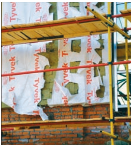
Фото 3. Некачественная установка утеплителя под ветрозащитной пленкой

3. Ветрозащитная пленка может использоваться для умышленного сокрытия дефектов теплоизоляционного слоя. При этом, например, имеются щели между плитами утеплителя или не производится крепление фрагментов плит утеплителя. В последнем случае в процессе эксплуатации фасада слой утеплителя может быть нарушен, и, соответственно, существенно снизится теплозащита здания. К сожалению, такие случаи для строительной практики — не редкость (фото 3).