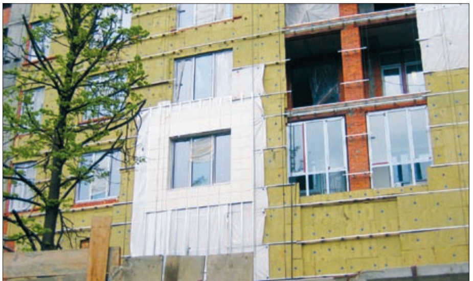
Фото 1. Установка ветрозащитной пленки между направляющими не позволяет получить толщину воздушной прослойки больше толщины вертикальной направляющей — 25 мм

Несущие функции в навесных вентилируемых фасадах выполняет металлический каркас (подконструкция), образованный горизонтальными и вертикальными направляющими. Очень часто в таких системах ветрозащитная пленка устанавливается не поверх утеплителя, что было бы логично, а между направляющими (фото 1). В результате толщина вентилируемой прослойки между пленкой и облицовкой становится равной толщине вертикальной на-