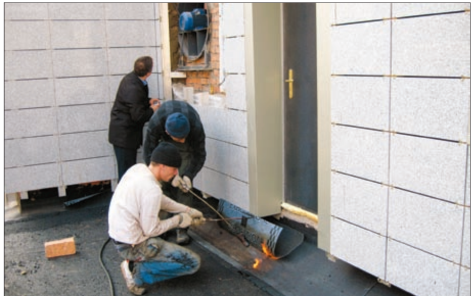
Фото 4. Огневые работы при наплавлении гидроизоляции вблизи нижнего продуха воздушной прослойки

4. Ветрозащитные пленки являются изделиями на полимерной основе и относятся к материалам группы горючести Г2, при воздействии на них открытым огнем происходит их возгорание (с вытекающими последствиями — при возникновении пожара они могут способствовать его развитию). Какую опасность могут представлять горючие компоненты фасадных систем, показали пожары, произошедшие в последнее время. Например, возгорание пленки «Тайвек» при проведении сварочных работ на 17 этаже здания со смонтированным фасадом привело к распространению огня до первого этажа и к многочисленным повреждениям фасада. Практически невозможно исключить применения открытого огня при проведении ряда работ на здании с уже смонтированным фасадом: это кровельные работы на крыше, сварочные работы на балконах и лоджиях, наплавление гидроизоляции на отмостке здания (фото 4) и т. д. Поэтому практически нельзя исключить возможность возгорания ветрозащитной пленки.