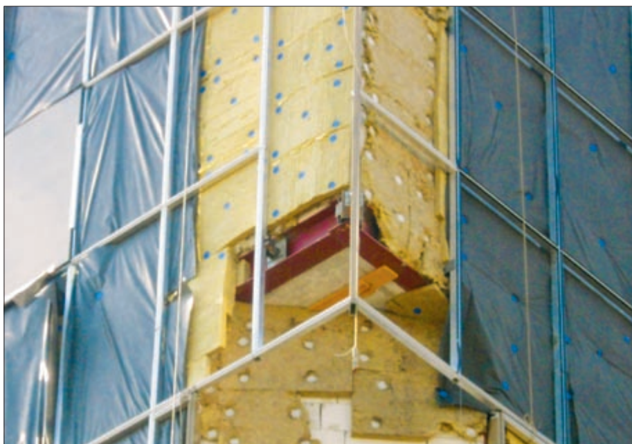
Фото 5. Повреждения минераловатного утеплителя при перерыве монтажа фасада

облицовки. Иногда этот перерыв достигает нескольких месяцев. В течение такого большого времени утеплитель может быть существенно поврежден вследствие климатических воздействий (фото 5). В таких случаях установка ветрозащитной пленки должна защитить утеплитель от повреждений.