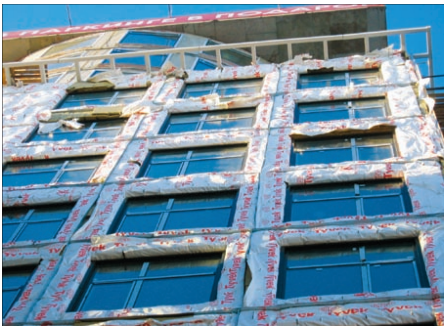
Фото б. Повреждения ветрозащитной пленки при перерыве в монтаже фасада

Мы проводили работу, в процессе которой выполнялись расчеты увлажнения утеплителя вентилируемого фасада косым дождем с учетом аэродинамики здания. Результаты, полученные при анализе